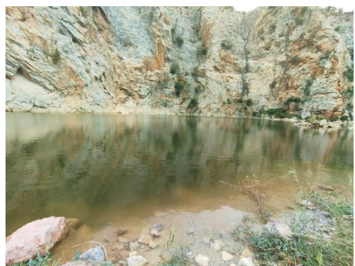
ลักษณะภูมิประเทศพื้นที่โครงการ